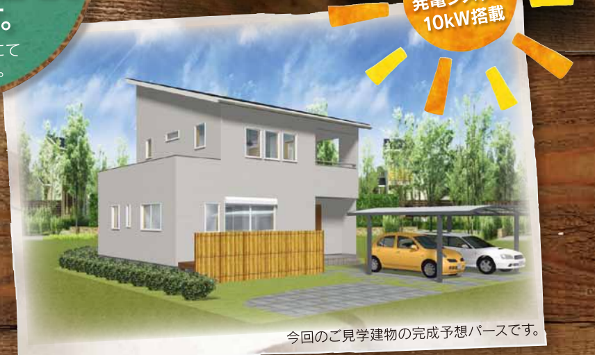
今回のご見学建物の完成予想パースです。